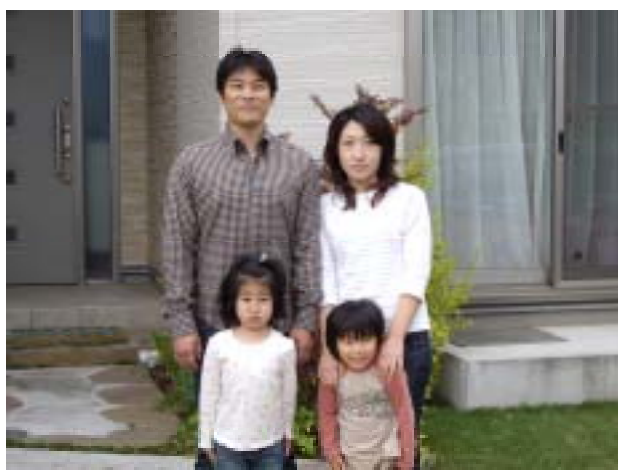
(H様ご自宅前にて、ご家族で記念撮影)

という風に大変街も暮らしも気に入っていただいているH様でした。(ミサワホーム 担当)